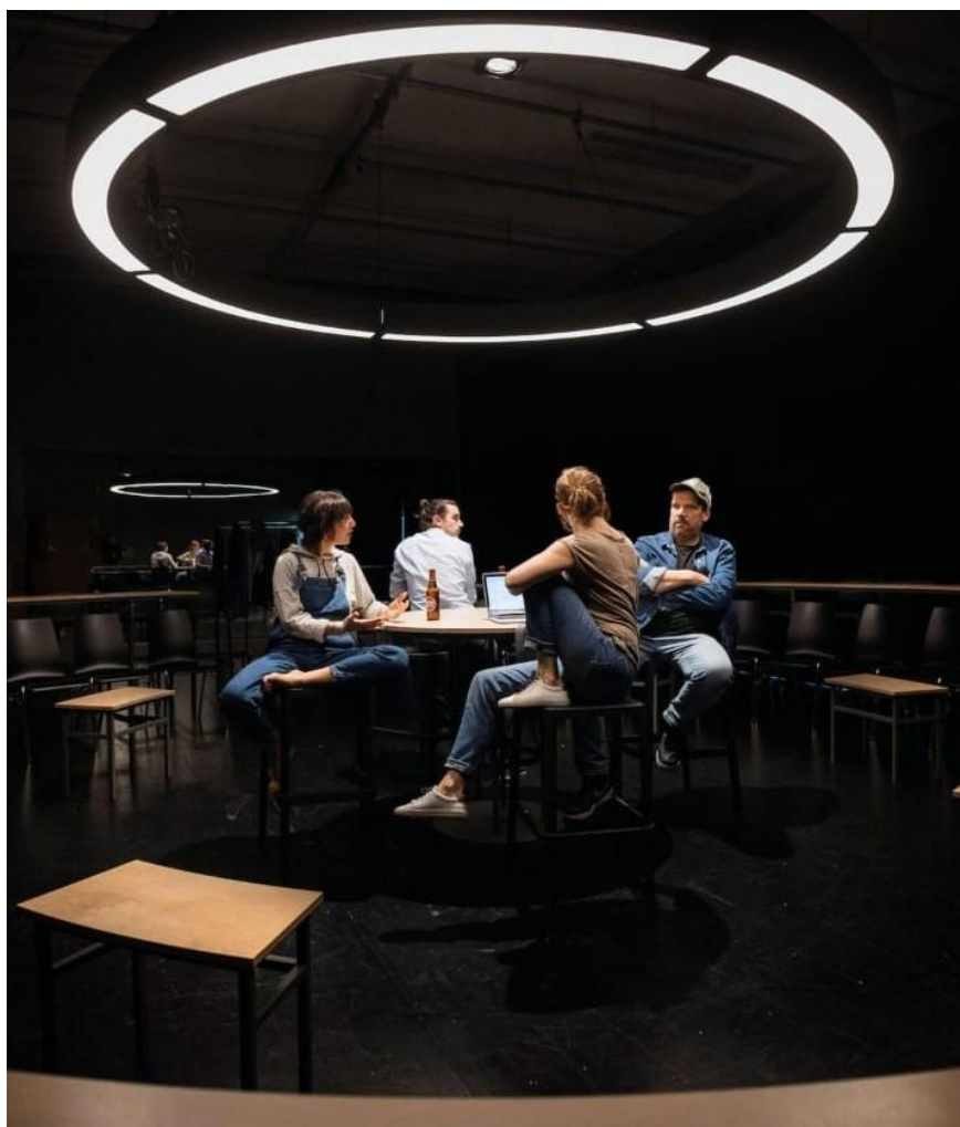
Fairfly - Cie Magnifique Théâtre ©Guillaume Peret, à Nuithonie

Coriolis Infrastructures est une Association de communes pour la politique culturelle dans l'agglomération de Fribourg fondée en 1999, afin de réaliser et exploiter une salle de spectacles à Fribourg, Equilibre, et un centre de création scénique à Villars-sur-Glâne, Nuithonie. Elle est financée par six communes, Fribourg, Villars-sur-Glâne, Granges-Paccot, Givisiez, Corminboeuf et Matran, ainsi que par le Casino Barrière de Fribourg.